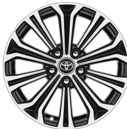
Легкосплавные диски, шины 225/45R17