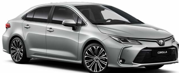
1F7 Серебристый металл