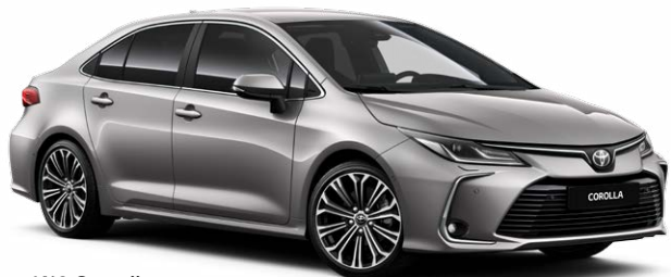
1K0 Серый металлик