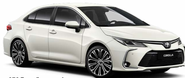
070 Белый жемчуг 5