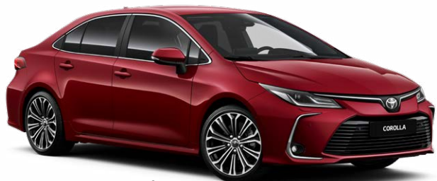
3T3 Темно-красный 5