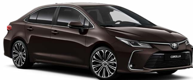
4W9 Темно-коричневый металлик