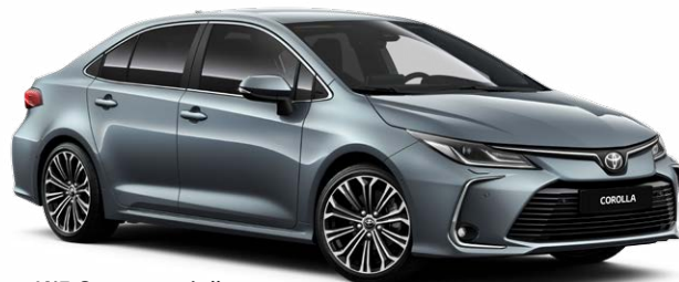
1K3 Серо-голубой металлик