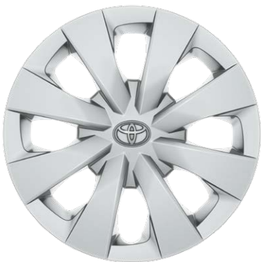
Стальные диски, шины 195/65R15