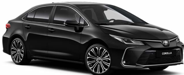
209 Черный металл