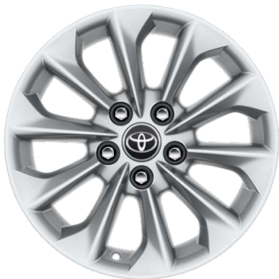
Легкосплавные диски, шины 205/55R16