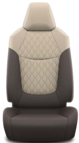
Бежевая ткань с ромбовидной прострочкой