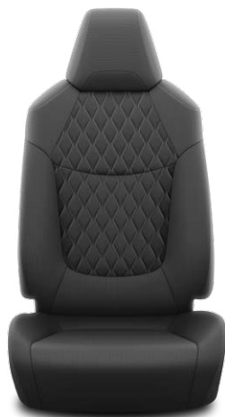
Черная ткань с ромбовидной прострочкой