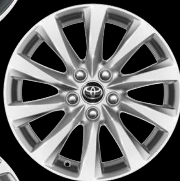
17" диски (10 спиц) Для комплектации Престиж