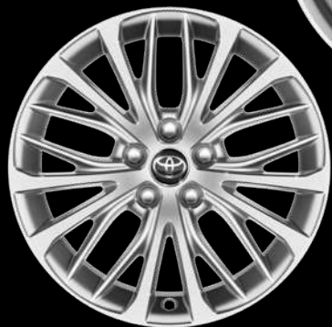
18" диски (20 спиц) Для комплектаций Престиж Плюс, Люкс и Люкс (3,5 л)