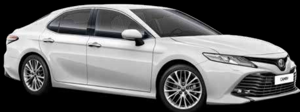
089 Белый жемчуг*