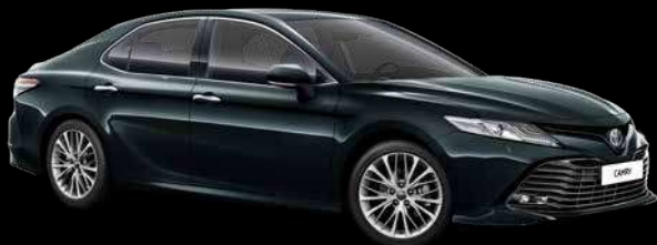
221 Черный изумруд*