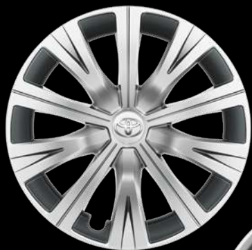
16" диски (10 спиц) Для комплектаций Стандарт, Классик, Классик Плюс, Комфорт и Элеганс